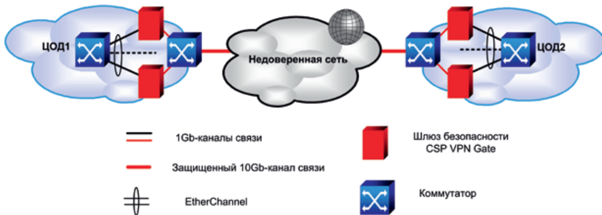
Рис. 2. Защита канала 10Gb на уровне L2

для обеспечения отказоустойчивости все устройства и каналы можно продублировать.